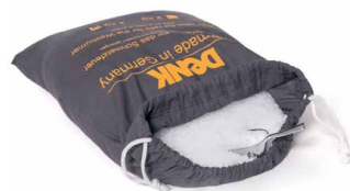
Wachspastillen zum Nachfüllen SFP2 2kg SFP4 4kg