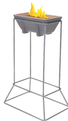
Ständer Schmelzfeuer XL H 60 cm | B 39 cm | T 28 cm | 2,2 kg SXLG-STE aus Edelstahl